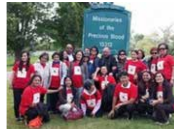
Il Gruppo di Preghiera del Prezioso Sangue El Shaddai celebra la loro fede.

La USC e gruppi simili promuovono inoltre il tipo di attività che il papa spera di vedere da tali associazioni e specialmente la formazione dei laici per