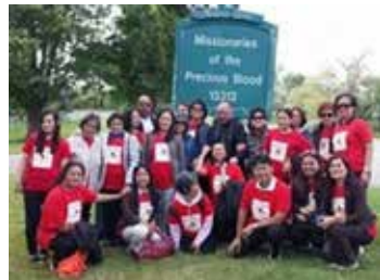
The El Shaddai Precious Blood Prayer Group celebrates their faith.

The USC and allied groups furthermore foster the kind of relationships the pope hopes for from such associations and especially the formation of the laity for mission. In such assemblies one can find the sort of laypersons “who have a deeply-rooted sense of community and great fidelity to the tasks of charity, catechesis and the celebration of the faith.” But they must bear in mind that lay mission is not confined to “tasks within the Church and that their various involvements must also result in “a greater penetration of Christian values in the social, political and economic sectors” through “a real commitment to applying the Gospel to the transformation of society” (cf. no. 102).